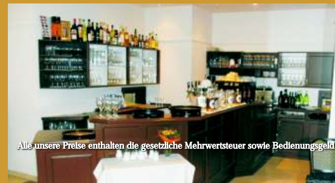
Alle unsere Preise enthalten die gesetzliche Mehrwertsteuer sowie Bedienungsgeld

Fleischgerichte (außer 88) servieren wir mit Backofenkartoffeln, Fischgerichte mit Salzkartoffeln und jeweils tagesfrischem Gemüse.